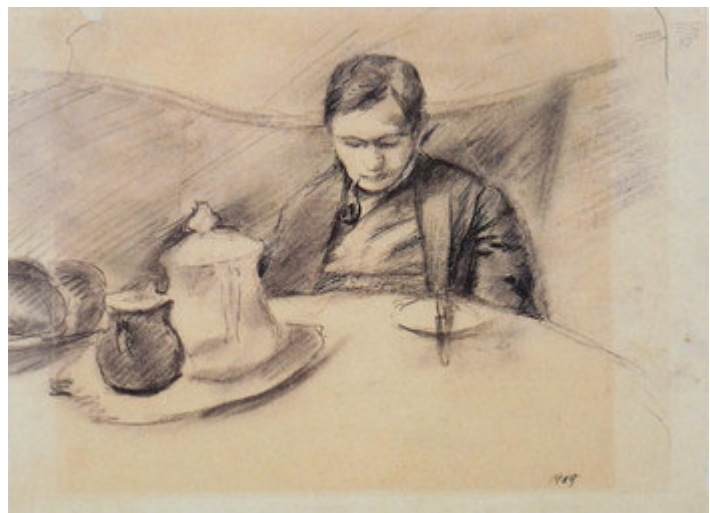
August Macke: Helmuth Macke, 1909, Bleistift, Kohle, Tuschfeder. Kunstmuseum Bonn, Leihgabe aus Privatbesitz